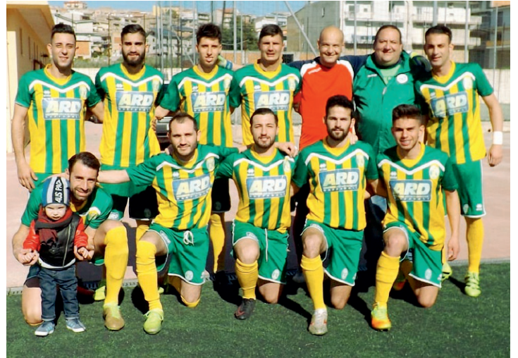
Una formazione del Raffadali. In questa stagione i gialloverdi sono stati a lungo in testa al torneo